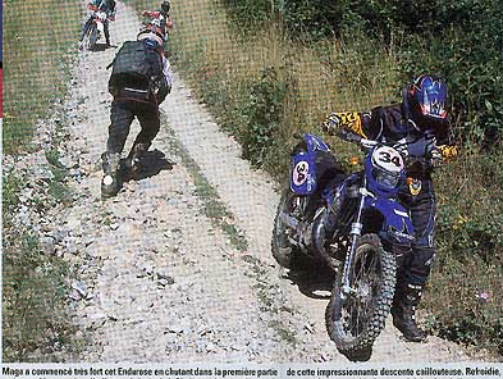
Maga a commencé très fort et l'Enduro a chuté dans la première partie mais pas découragée, elle l'a terminée à pied. Si elle avait eu... elle serait de cette impressionnante descente collante. Refoiné, quand même rose ! Le jeu se valait la chandelle.

Je suis vaincue, victorie ! Michaël, instructeur M.J. moto et Kerom, retrouvé et c'est super de le voir. Mais là, j'en peux plus, je m'arrête... et je craque. De chagrin larmes remplissent mes yeux. J'enlève mon casque et mes lunettes, bon un coup au Camélabik... C'est le moment de sortir les tubes magiques que ça s'appelle Jeff... m'assure Michaël. Bien qu'armatisée, la gelée m'écroule sur l'est pas ça homme. Je l'avais quand même. Si seulement ça pouvait me sequenter !